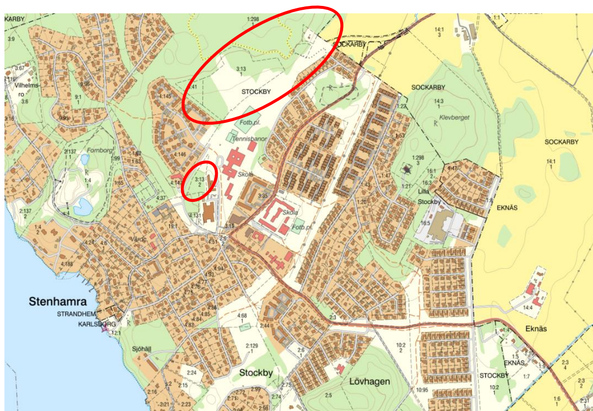
Figur 1: Karta som redovisar detaljplanens preliminära utredningsområde i rött.

I RUFS 2050 är området utpekade som en landsbygdsnod. En landsbygdsnod är en ort som har betydelse för den omgivande landsbygden och som bedöms ha potential att utvecklas som både nod och bostadsort. I RUFS 2050 finns det riktlinjer som Regionen bedömer är lämpliga att förhålla sig till när kommunen planerar sin utveckling.