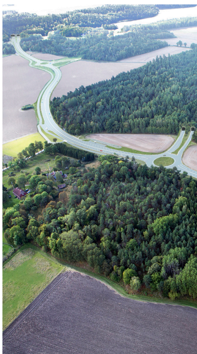
Trafikplats Lovö. Illustratör Trafikverket.

Infrastrukturen kommer utvecklas kraftigt under 2020-talet. Bygandet av Förbifart Stockholm/E4 och breddningen av Ekerö vägen/261 innebär att Ekerö får ett betydligt mer centralt läge med god tillgänglighet till både norra och södra delarna av Stockholmsregionen.