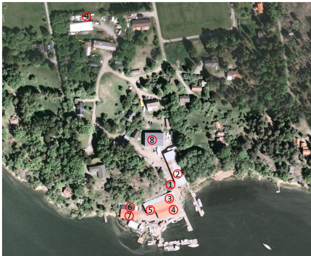
Figur 3: Markering av de större arbetshallarna samt verkstäderna för reparationsarbeten vid Mäläröarnas båtvarv.