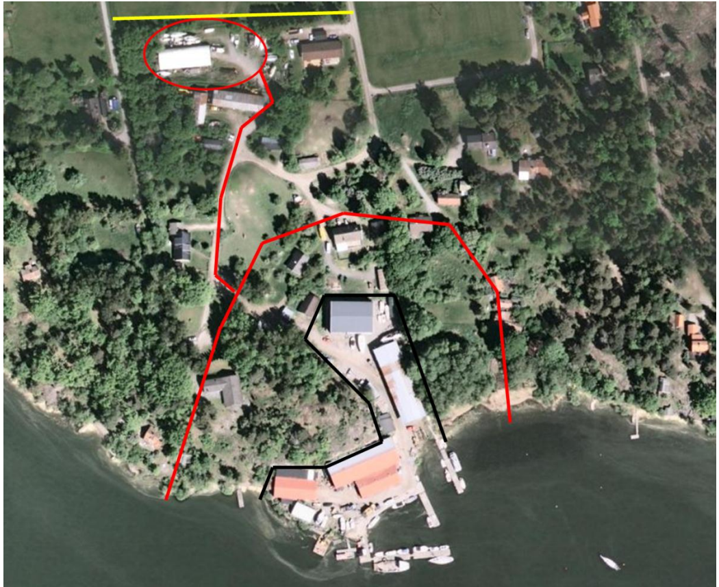
Figur 5: Verksamhetsområde (svart linje) med 50 meter skyddsavstånd (röd linje). Röd cirkel markerar arrenderat område där viss uppställning av båtar och materiel sker. Röd linje visar transportsträckan mellan varv och arrenderat område. Gult sträck (i överkant) markerar förslag till placering av nytt gångstråk.