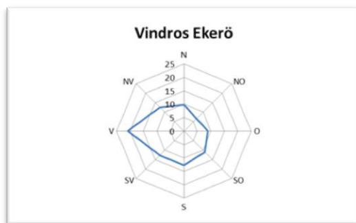
Figur 2: Vindros över Ekerö kommun. Vinddata från SMHI:s väderstation på Adelsö, Ekerö kommun.